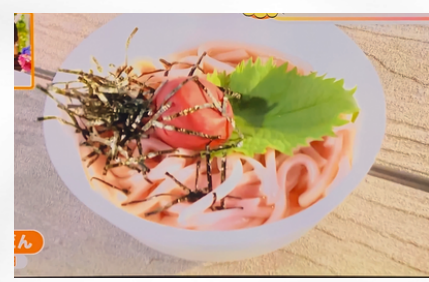
「梅うどん」かざはや茶屋 "Ume udon" using plums harvested in Kazahaya no Sato