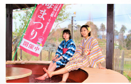
足湯 Enjoy "Ashiyu" (foot bath) while viewing of plum blossoms, wisterias, hydrangeas and autumn cherry blossoms