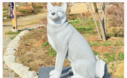
聖徳太子の愛犬「雪丸」 Pet dog of Prince Shotoku "Yukimaru"