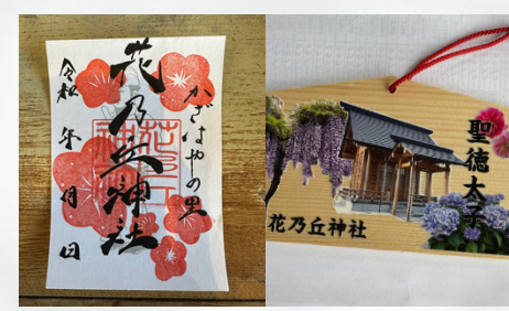
「絵馬」「御朱印」 Ema and Goshuin drawn by people with disabilities