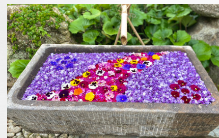
藤の花で作る花手水 Wisteria Hana Chozu (Floating flower)