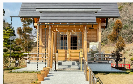
花乃丘神社参拝 Visit Hananooka Shrine, which worships the god of welfare, Prince Shotoku