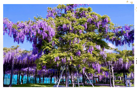
「濃紅紫色の藤が圧巻 八重黒龍タワー」 "Yae Black Dragon Tower" The deep red-purple wisterias are spectacular