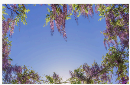
「世界にひとつのデザインの藤棚」のハートの空 The heart-shaped sky of wisteria trellis with a unique design in the world